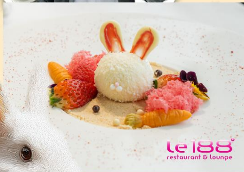
le 188 restaurant & lounge