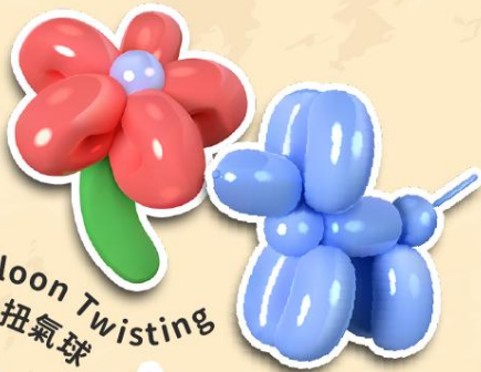
Balloon Twisting 扭氣球