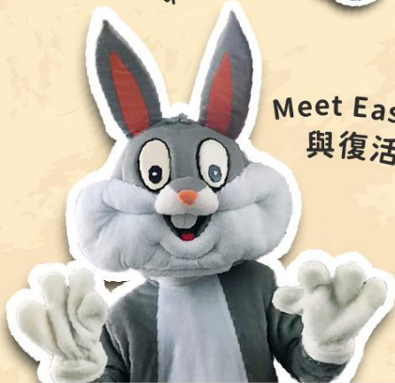
Meet Easter Bunny 與復活兔見面