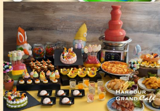
HARBOUR GRAND Cafe